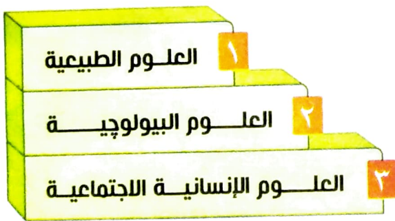
سلم تدرج العلوم

العلوم الطبيعية خاصة علم الفيزياء، وهو أكثر فروع العلم عمومية لأنه يبحث فى إطار الكون أو مجمل عالم الظواهر التى نراها.