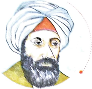
الحسن بن الهيثم