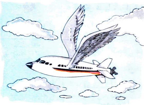
الطائرة كعمل إبداعى

* الإبداع نشاط عقلى مركب وهادف ، توجهه رغبة قوية فى البحث عن حلول أو التوصل إلى نواتج أصيلة لم تكن معروفة سابقاً،