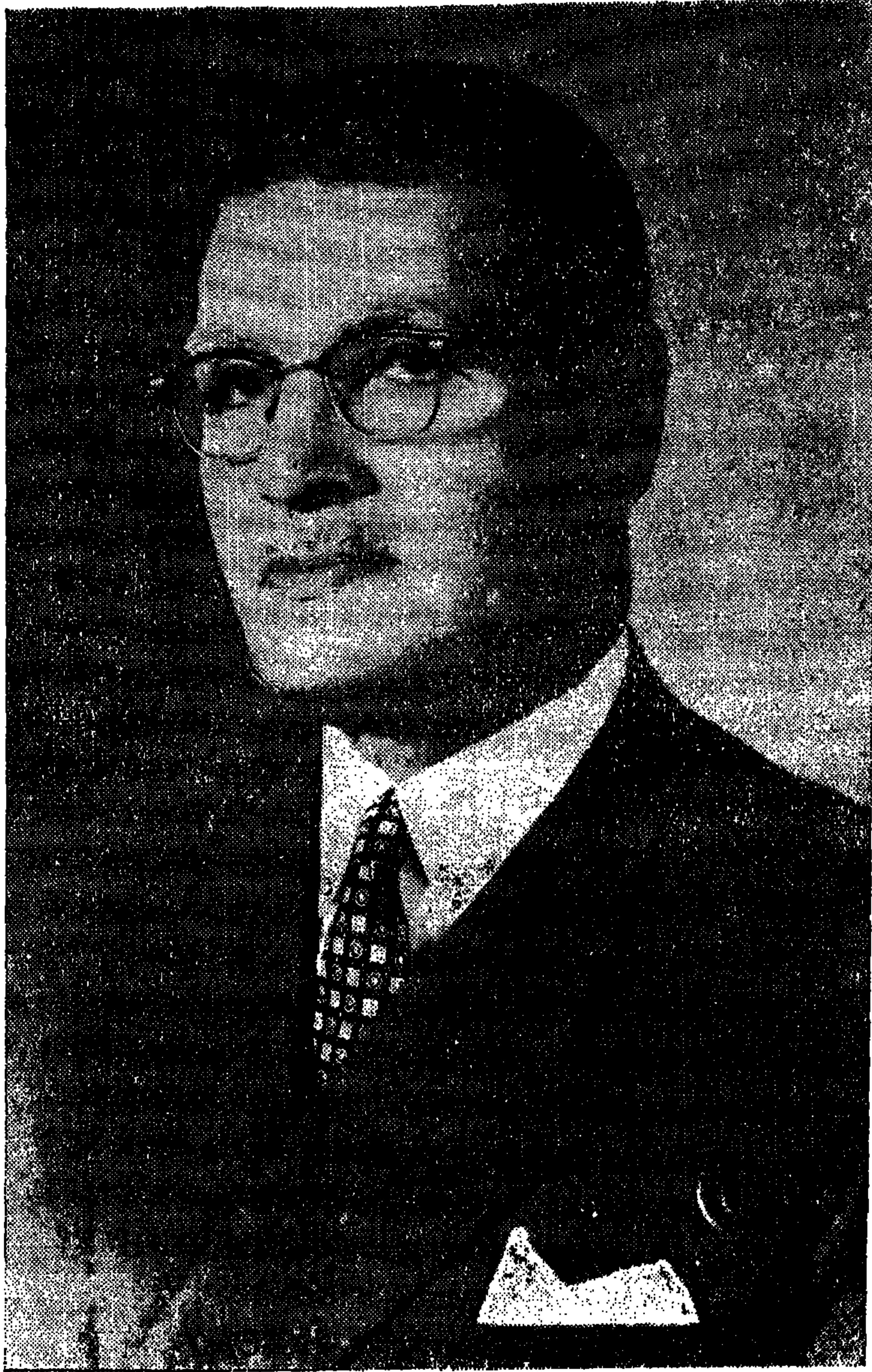
المؤلف وهو في الخامسة والستين من عمره