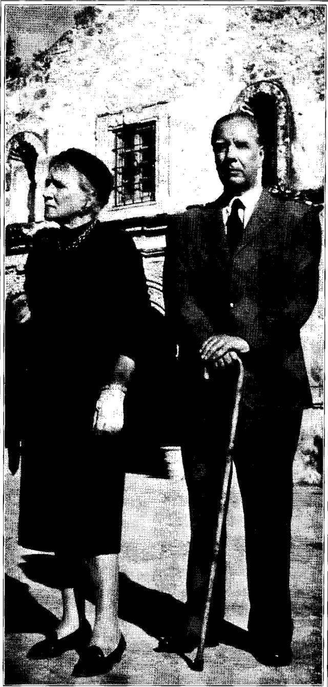
بورخس ووالدته .