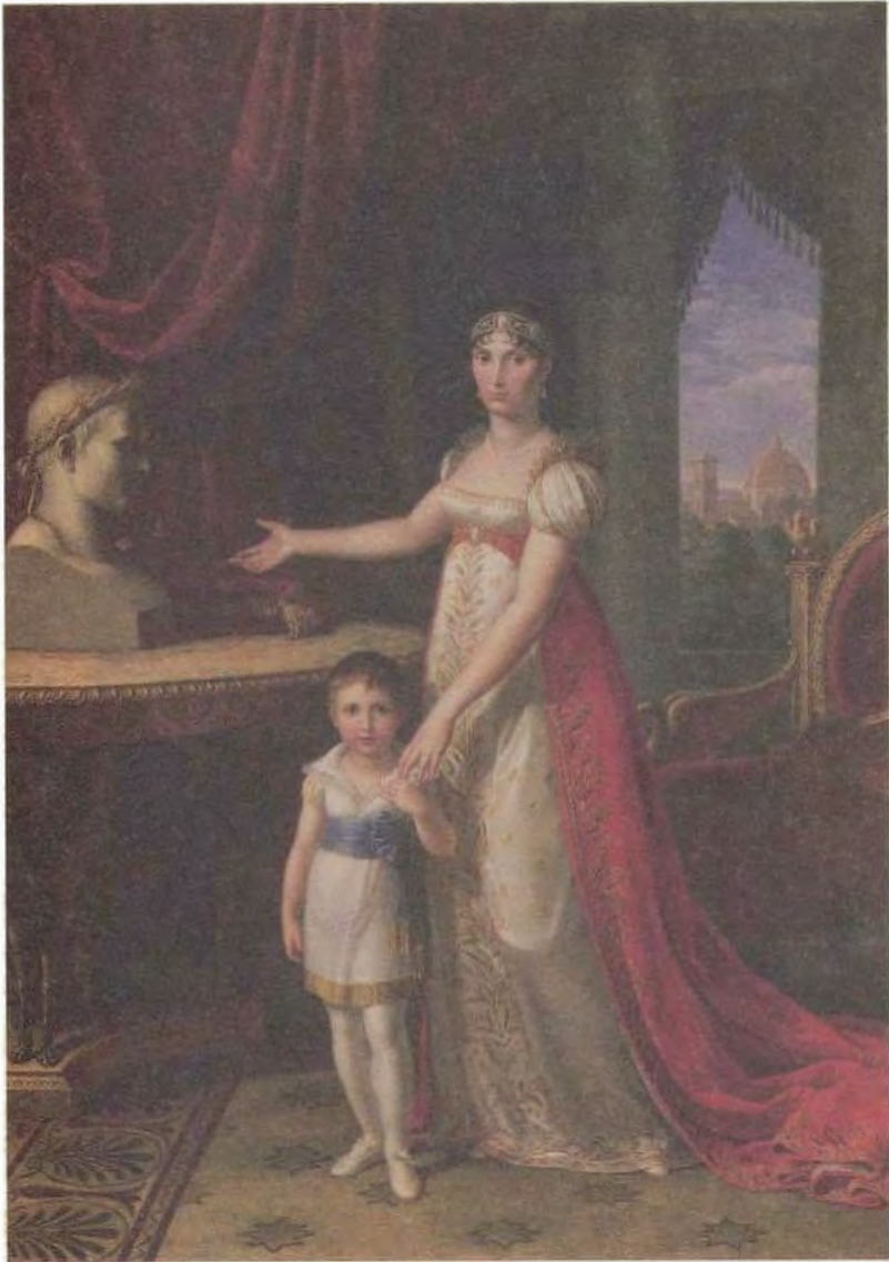
إليزا بوناپرت، دوقة توسكانيا الكبيرة وابنتها نابوليون - إليزا. صورة رسمها بيتر بنفينوتي.