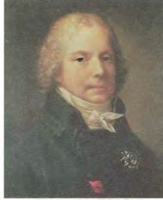
فوق، شارل موريس دي تاليران بريغور، صورة رسمها بيار بول برودهون. إلى اليسار، نابليون بوقفته المميّزة أمام قصر ماليزون في سنة 1804، صورة رسمها فرانسوا باسكال سيمون، البارون جيرار. الإمبراطورة جوزفين في ماليزون، صورة رسمها البارون جيرار أيضاً.