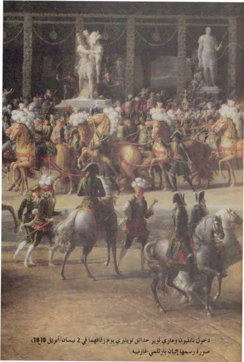
دخول نابليون وهاري لويز حدائق توليري يوم زفافهما في 2 نيسان/أبريل 1810، صورة رسمها إتيان بارتلمي غارنييه.