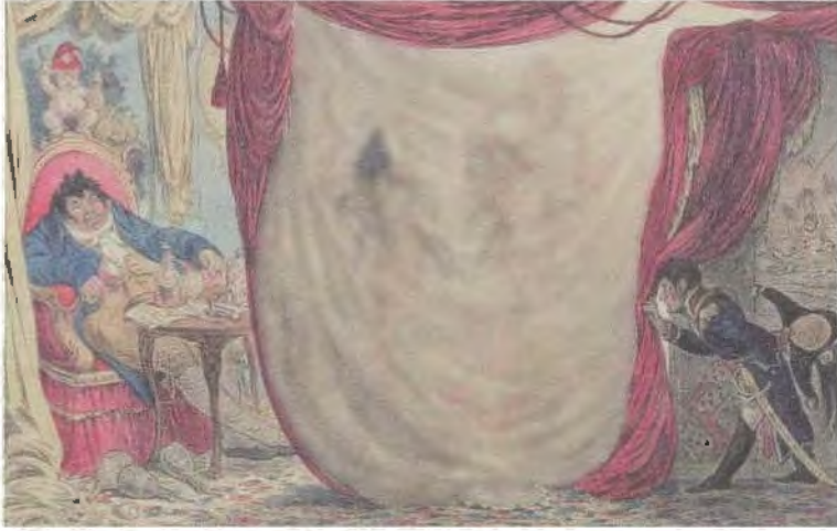
مدام تريزا تاليان والإمبراطورة جوزفين ترقصان عاريتين أمام الفايكونت دي بارا في شتاء 1787.