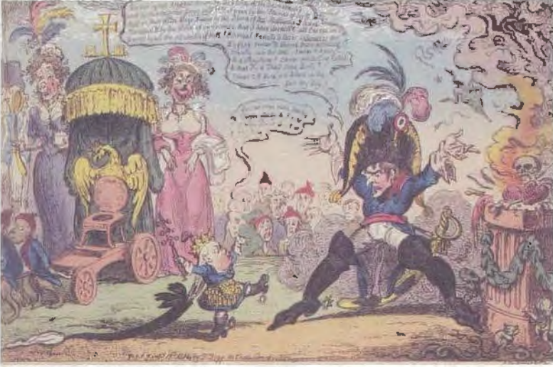
نابليون وملك روما يقسمان على العداوة الدائمة لإنجلترا، كاريكاتور من صنع جورج كروكشانك.