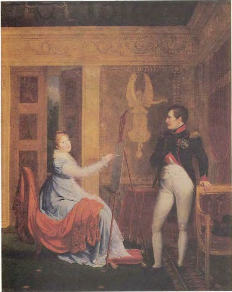
ماري لويز ترسم صورة لنابليون، صورة رسمها ألكسندر منجود.