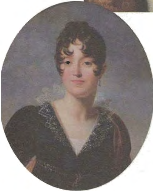
فوق، ألكسندر دي بوهارنيه، الزوج الأول للإمبراطورة جوزفين. إلى اليسار، ديزيريه كلاري، صورة رسمها فرانسوا باسكال سيمون، البارون جيرار.