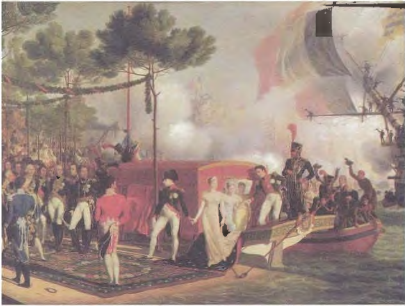
نابليون وماري لويز يتزجلان في أنتويرب في أثناء سفرهما في سنة 1810، صورة رسمها لويس فيليب كريان.