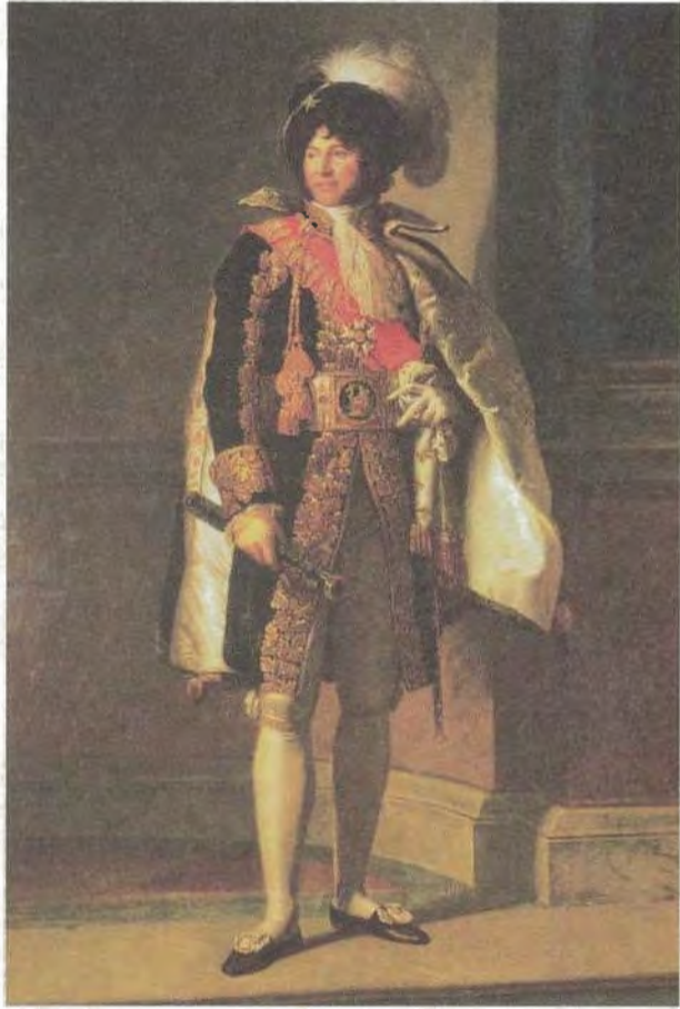
يواكيم مورا، ملك نابولي، صورة رسمها فرانسوا باسكال سيمون، البارون جيرار.