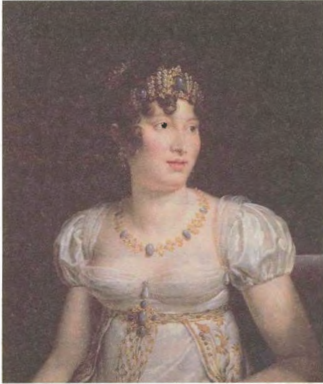
كارولين مورا، ملكة نابولي، صورة رسمها فرانسوا باسكال سيمون، البارون جوار.