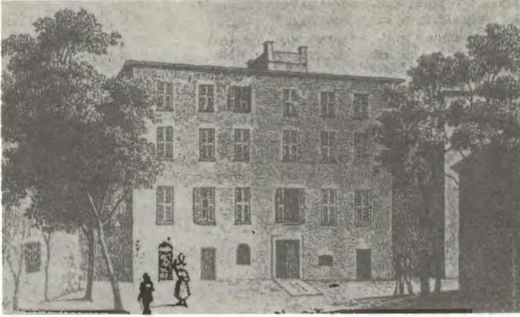
المنزل الذي ولد فيه نابليون في 15 آب/أغسطس في شارع مالربا بمدينة أجاكسيو

ماريا لتيزيا رامولينو بونايرت، والدة نابليون. صورة رسمها فرانسوا باسكال سيمون، البارون جيرار.