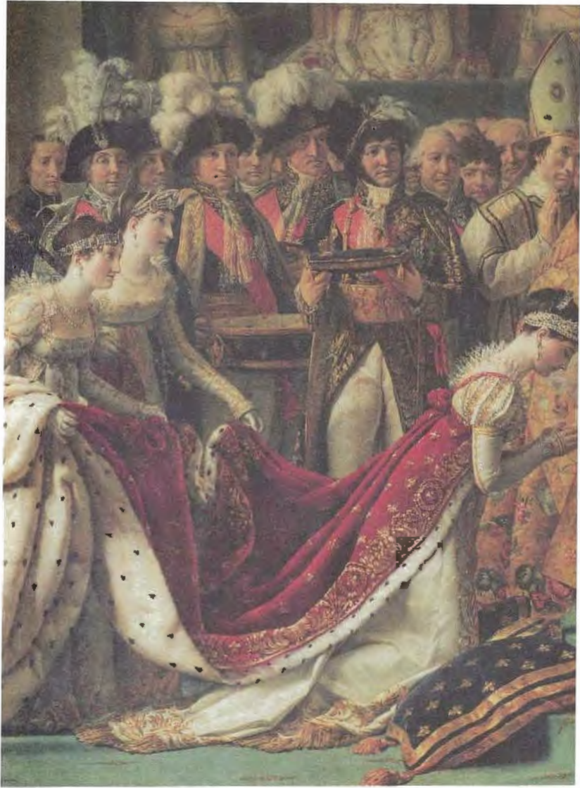
حفلة تتويج الإمبراطور نابليون والإمبراطورة جوزفين بحضور البابا بيوس الثاني عشر في 2 ديسمبر 1804، صورة رسمها جاك لويس دافيد.