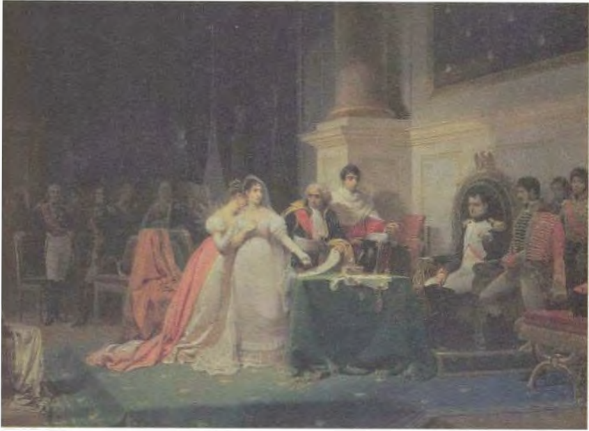
طلاق الإمبراطورة جوزفين، صورة رسمها هنري فريدريك شوبان.