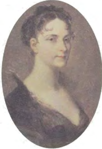
الإمبراطورة جوزفين، صورة رسمها ييار بول برودون.