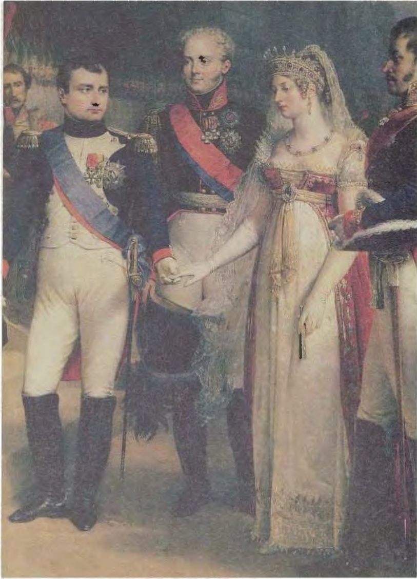
نابليون بونابرت مستقبلاً ملكة بروسيا لويزا في تلسيت في 6 تموز/يوليو 1807 ، صورة رسمها نيكولا لويس فرانسوا غوس