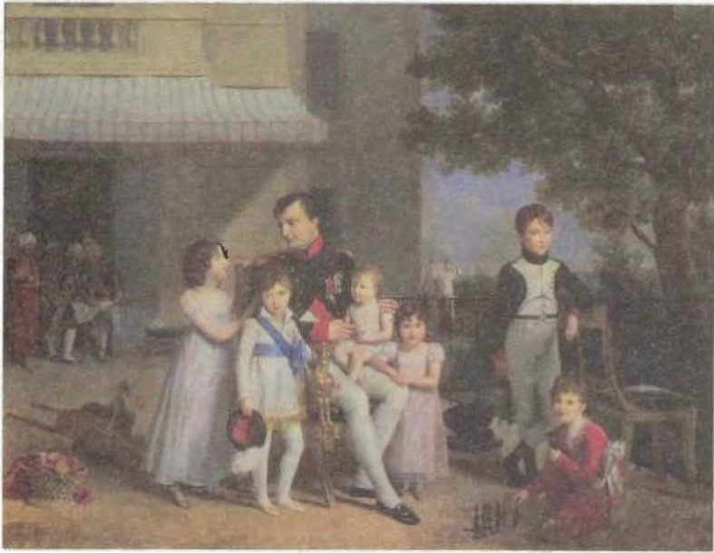
نابليون مع أبناء وبنات إخوته على شرفة قصر سان كلو في سنة 1810، صورة رسمها لويس دوسيس.