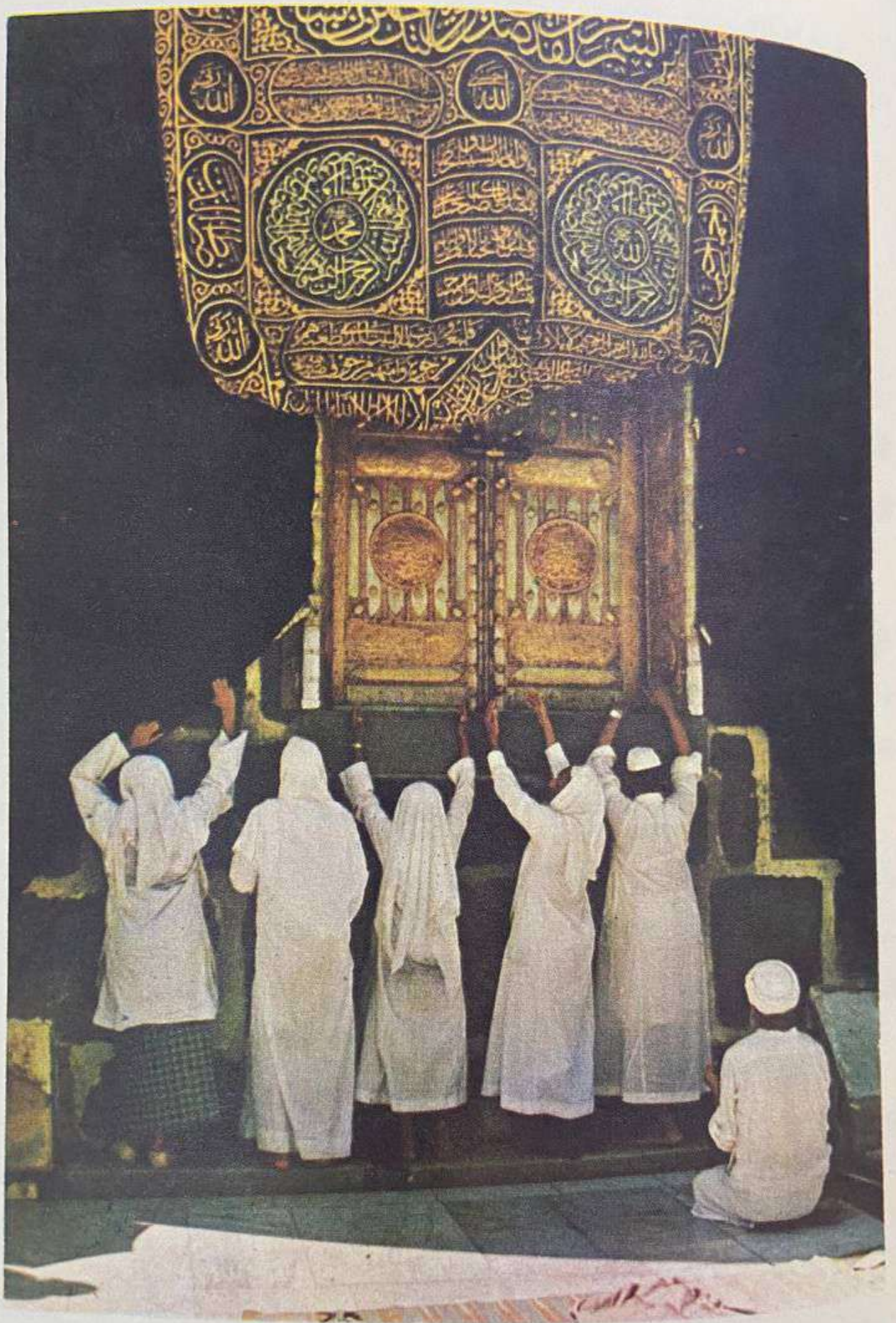
اناس يدعون الله تحت باب الكعبة المشرفة