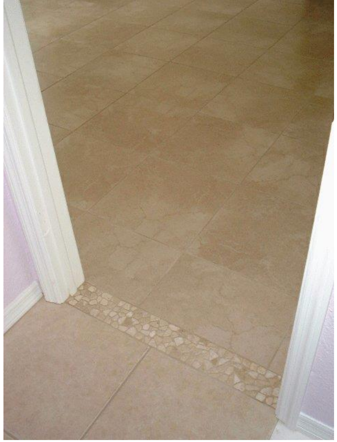
لنشاهد معا بعض الارضيات