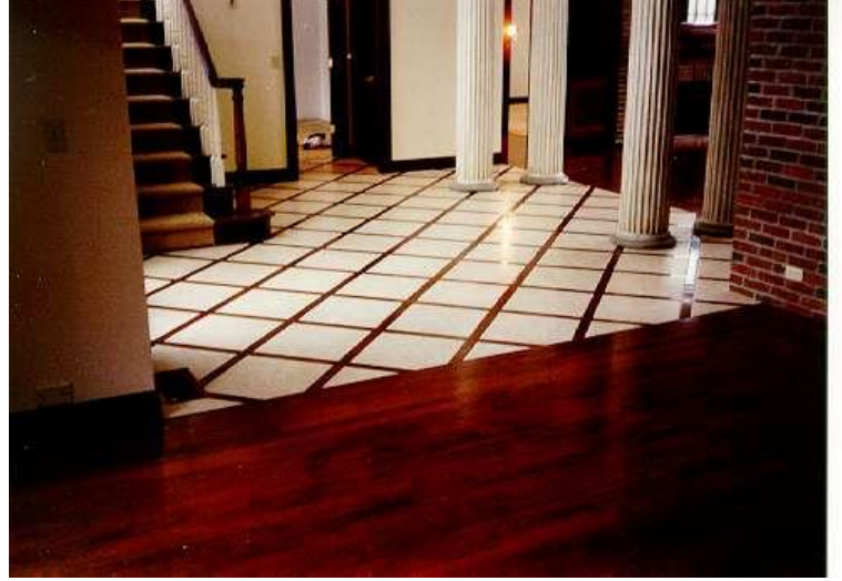
سيراميك مع موزاييك بالوسط

أما البورسلين فلن تظهر طبقة كهذه والسبب انه صبة من طبقة واحدة وليس طبقتين وكذلك الحال للجرانيت والرخام فهما حجران قويان صورة متعددة الأشكال فيها سيراميك لامع وآخر مطفي وأشكال أخرى رائعة لا نستطيع التفريق بين اي من السيراميك والبورسلين وحتى الجرانيت والرخام اصبح منها الصناعي بشكل يصعب معرفته من النظرة الأولى