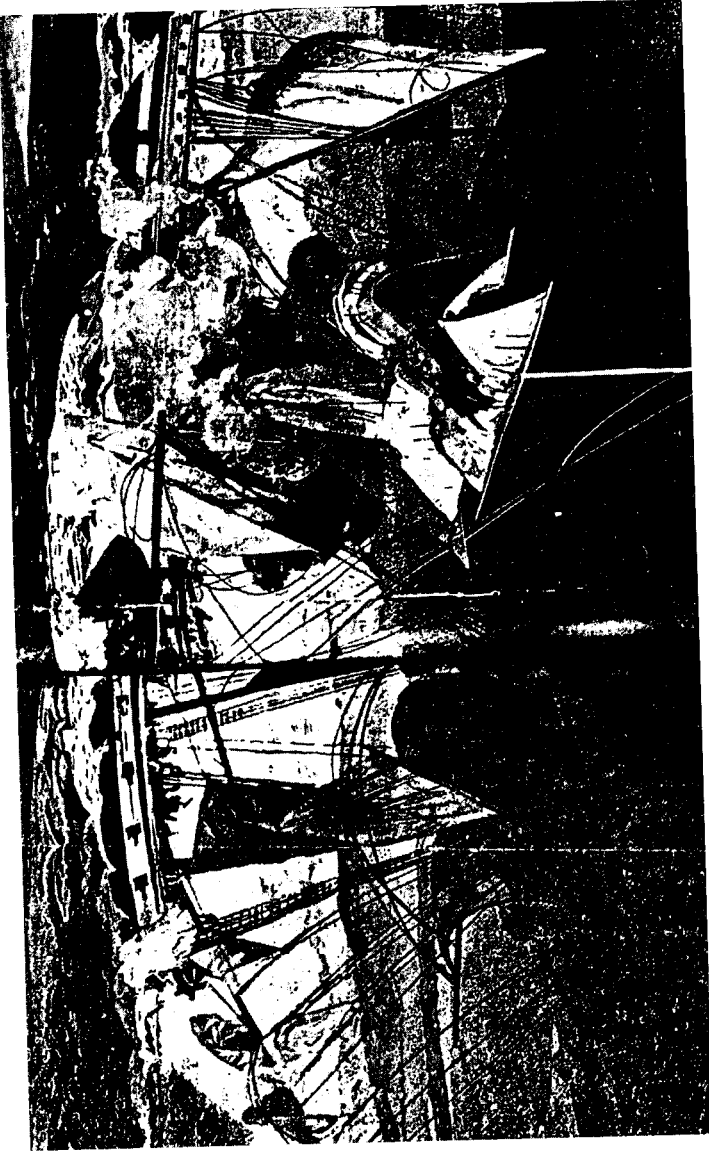
أسر فيلادلفيا الصورة عن كتاب تاريخنا، منشورات دار الشورى - جنيف.