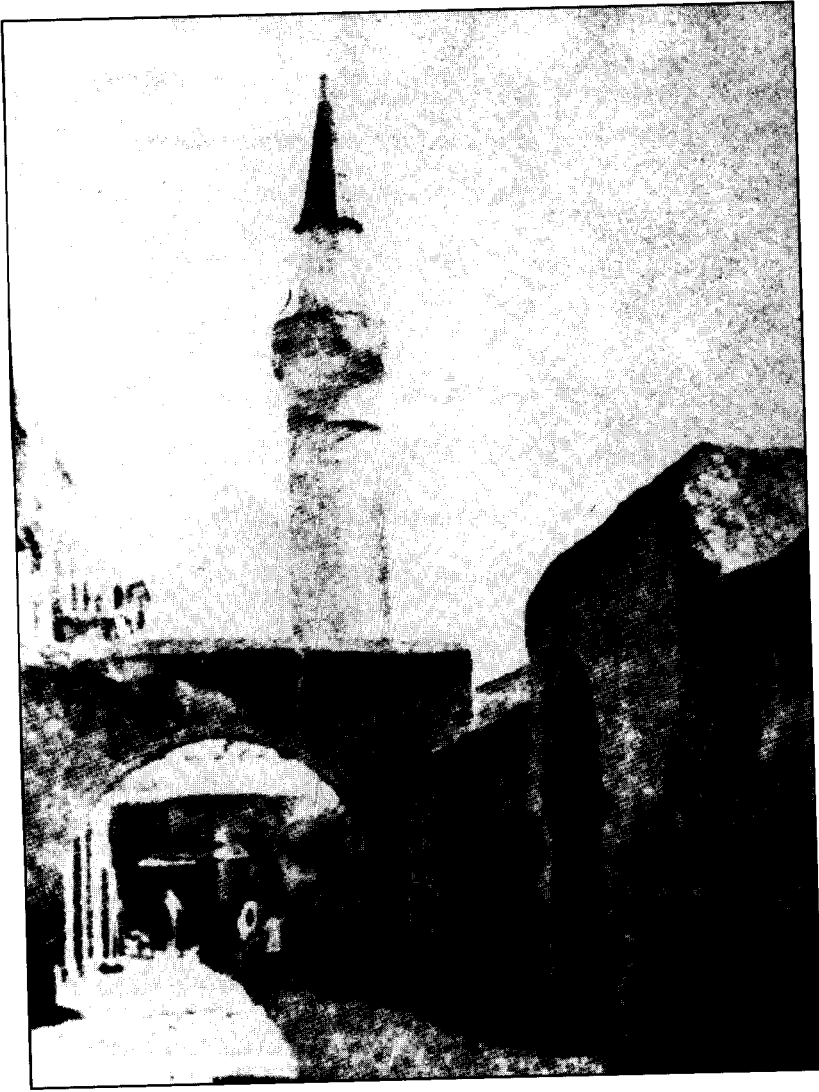
... جامع محمود