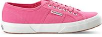
سوبرجا، 245 د.إ.ر.س