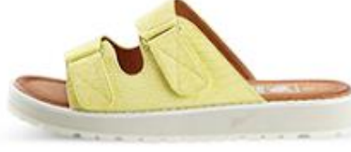
دون تو ارت، 200 د.إ.ر.س