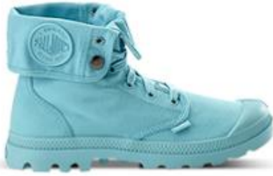
بالديوم، 295 د.إ.ر.س